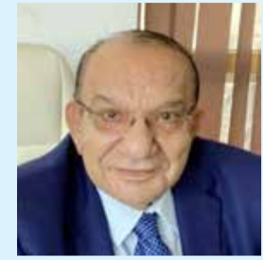
تخاريف اليفيا فى الملاعب

محمد صلاح أفضل لاعب فى العالم وعليه وعلينا الفخر والسعادة لما يحققه من إنجازات.. هذه هي الحقيقة، وإذا كان الاتحاد الدولي لكرة القدم فيفا فأجانباً جميعاً بالفوز واللوغريتمات فينا فى مصر والوطن العربى نحتفل بنجمنا.