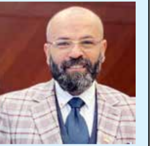
بقلم : خبير التأمين أحمد نبيه

إستساغ البعض - دون عمد بالطبع- تسمية برامج تأمين الحياة التي تقدمها شركات التأمين، سواء في مصر أو في العالم، بأنها تأمين على الحياة، وهو توصيف خاطئ ولن أقول مظل، بل على الأقل ينفر ضعاف الوعي منه كلية. المسمى الدقيق والمنضبط هو تأمين الحياة، وليس التأمين على الحياة.